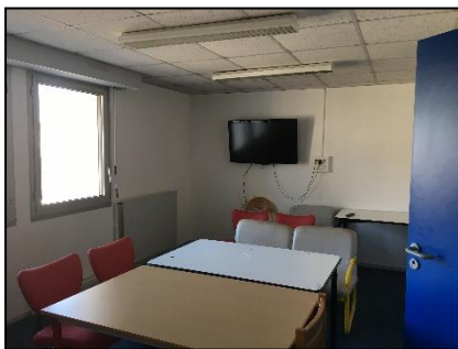
Salle d'études internat

Les internes doivent se munir de toutes leurs affaires nécessaires pendant la journée.